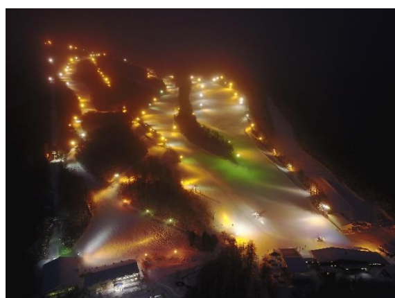
「みやぎ蔵王えぼしリゾート」 広大なナイターゲレンデ