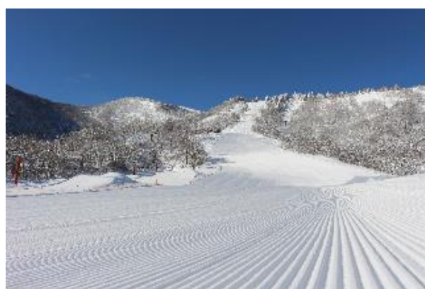
「みやぎ蔵王えぼしリゾート」

NSDは2005年の創業以来、長野県で6スキー場、群馬県1スキー場・岐阜県1スキー場（計8スキー場）のほか、レンタルショップなどを運営しております。