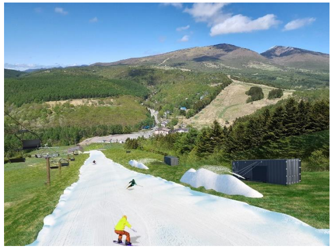
※山頂からのイメージ（根子岳と四阿山が望めます）