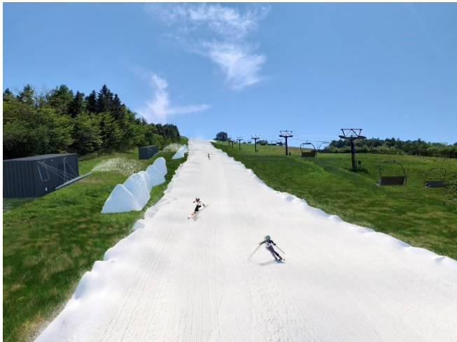
※山麓からのイメージ

近年の気温上昇や降雪不足のようなシーズンでも、オープン予定の大幅な延期や早期クローズなどがなくなり、安定してスキー場の営業ができるようになります。また、早期オープンやシーズン最後までコースコンディションを維持することができ、ロングシーズンでスキーを楽しむことが可能になります。