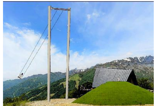
白馬ジャイアントスウィング パースイメージ

「白馬マウンテンハーバー」、「THE CITY BAKERY 白馬マウンテンハーバー」の誕生 5 周年を迎える 10 月 6 日には、超大型ブランコ「白馬ジャイアントスウィング」が白馬岩岳マウンテンリゾートに誕生いたします。「白馬ジャイアントスウィング」は、標高 1,100m の、唐松沢氷河や北アルプスの山々、眼下に広がる白馬村の田園風景が広がる「白馬ヒトキノモリ」エリアにでき、地面から 10m の高さで、最大で前方約 6m の振り幅を得られます。眼下に広がる白馬村の田園風景に飛び込むような非日常の浮遊感をお楽しみください。