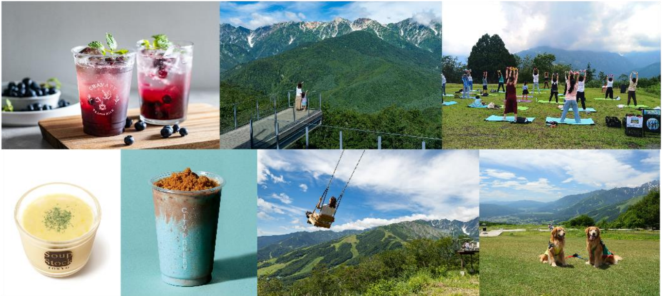
(左列上から) CHAVATY「ブルーベリーティーソーダ」、Soup Stock Tokyo 白馬店「とうもろこしとさつま芋の冷たいスープ」、THE CITY BAKERY「CBクッキーシェイク チョコミント」、(中央列上から) HAKUBA MOUNTAIN HARBOR、白馬ジャイアントスウィング、(右列上から) 絶景手ぶらリラックスヨガ、ペット来場の様子