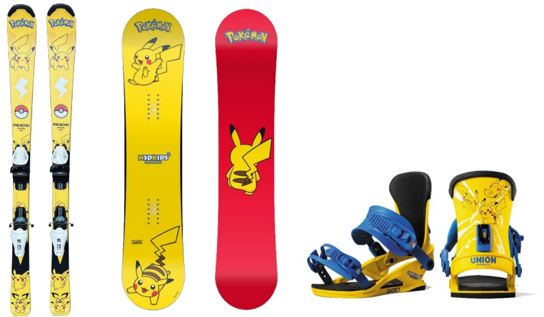
ピカチュウのスキー・スノーボード板・ビンディング (レンタル)