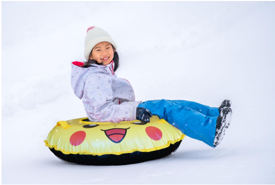
ピカチュウデザインのチュービング