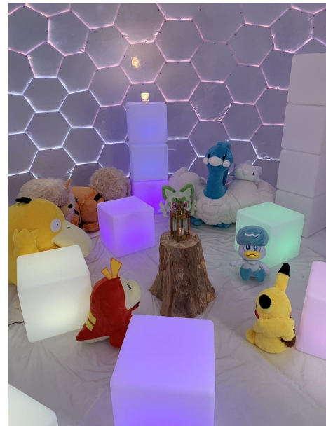
ゆきのほこら内装