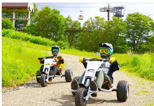
マウンテンカート