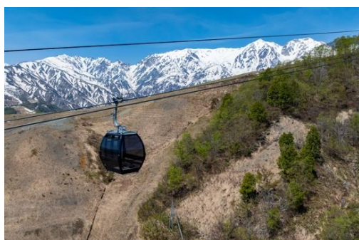
新ゴンドラリフト

新ゴンドラリフトは搬器あたりの乗車定員が増えたことにより繁忙期でも乗車の待ち時間が以前の半分以上に短縮され、また乗車中に大きな窓から見える 360°の風景は好評をいただきました。