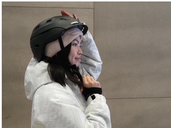
SMITH のヘルメットを採用

「スノボデビューするならお洒落なウェアでデビューしていただきたい」思いから、「スノボデビューする女性限定」レディースウェア無料レンタルを開始いたしました。貸出ウェアはお洒落で多彩なカラーバリエーションと幅広いサイズを取り揃え、自分のサイズや好みに合ったウェアを選んでいただけます。貸出の際には流行りのお洒落な着こなしや気温に合わせた着方もスタッフがレクチャーいたします。