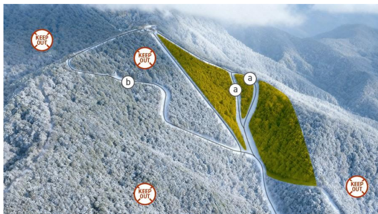
ツリーランエリアマップ