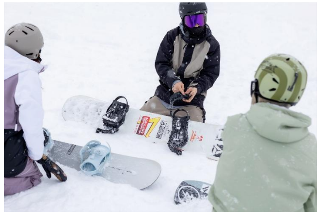
ブーツの履き方や板の使い方を 1 からレッスン