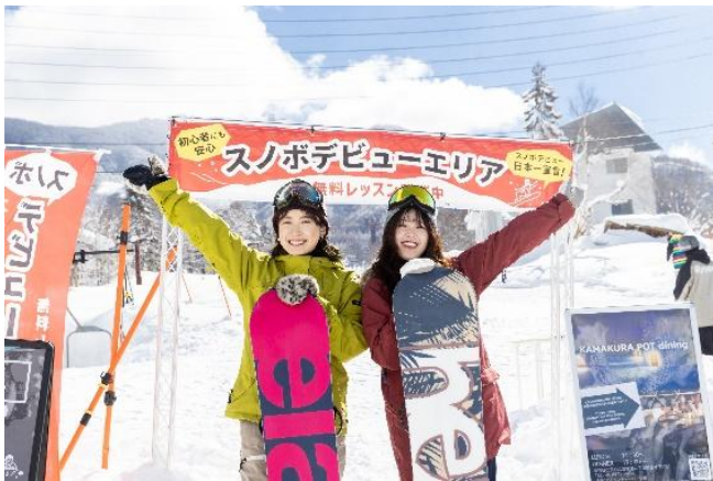
無料スノボデビューレッスン

スノボデビューレッスン詳細はこちら： https://ryuoo.com/winter/debut/