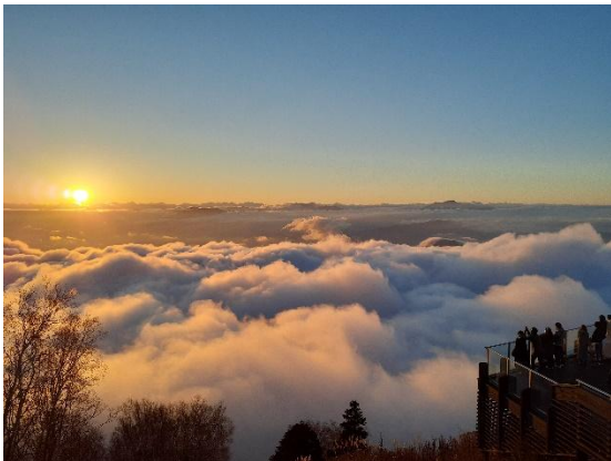
夕日に照らされた雲海