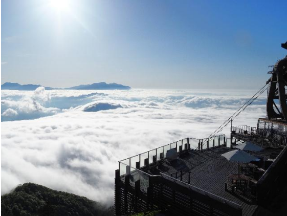
一面に広がる雲海（日中）

※2 竜王マウンテンリゾート調べ。1 日の中で雲海が出た日を 1 カウントし、営業日数で割った算出。