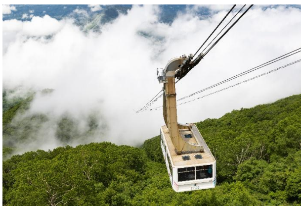
世界最大級 166 人乗りロープウェイ