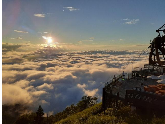
一面に広がる雲海（夕方）