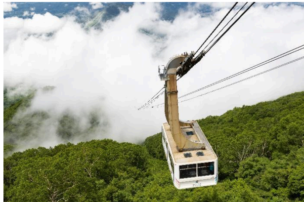
世界最大級166人乗りロープウェイ