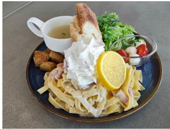
雲海レモンクリームパスタ