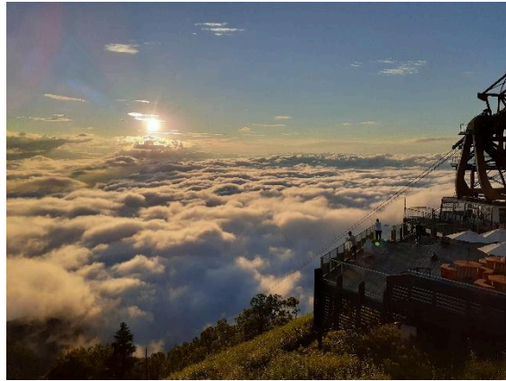
一面に広がる雲海(夕方)