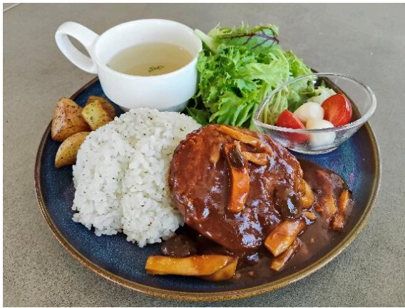
信州オレイン豚ハンバーグ