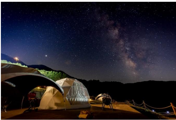
頭上に広がる満点の星