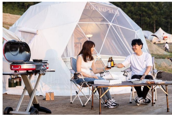
プライベート空間での BBQ ディナー