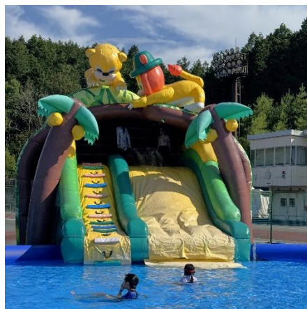
デンジャラスクルーズライダー