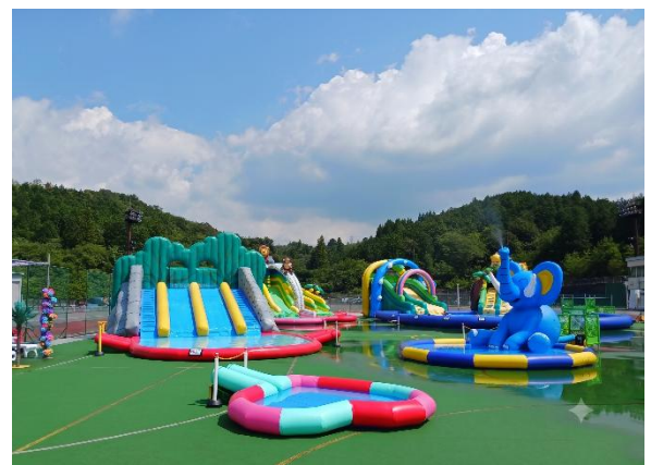
水遊びエア遊具エリア ※イメージ

水遊びエア遊具エリアでは、水に飛び込むスライダーや全長約 25m の大型スライダーなど、爽快感溢れるアイテムが揃います。また、小さいお子さまや幼児が安心して水遊びができる、浅瀬で安全設計の水遊びエア遊具もご用意しております。