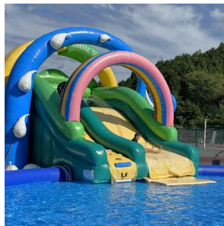
アフリカンアニマルスライダー